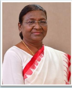
कुलाध्यक्ष श्रीमती द्रौपदी मुर्मू, भारत की माननीय राष्ट्रपति