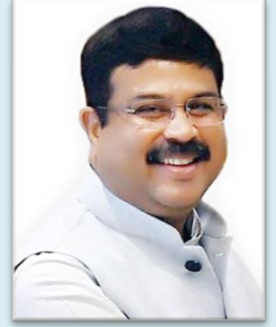
श्री धर्मेन्द्र प्रधान माननीय शिक्षा मंत्री