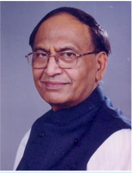
कुलाधिपति डॉ. सी. पी. ठाकुर